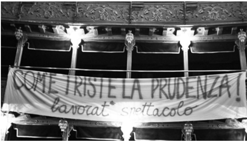
Foto simbolo del Valle Occupato: lo striscione con la frase di Rafael Spregelburd fatta propria dagli occupanti

Il fenomeno Valle ha – e avrà probabilmente a lungo – colori cangianti a seconda non solo degli accadimenti, ma anche degli sfondi sui quali lo si osserva. Tutto può mutare di senso, da un giorno all'altro. Anche per questo è importante esplicitare la data esatta in cui si sono chiusi i lavori per questo Dossier: il 20 di giugno del 2013.