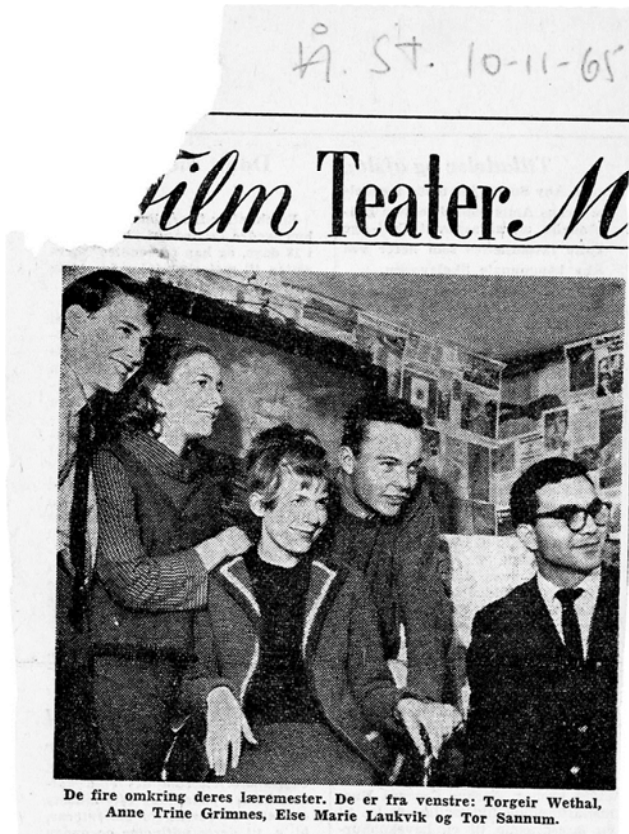
Immagine 2 – Ritaglio stampa, 1965 (OTA, fondo Odin, serie Activities-B, b.17).

Ritaglio stampa (1965); Jens Kruuse su Ornitofilene (1965); Scheda sull'Odin Teatret; Eugenio Barba sulla fondazione dell'Odin (2011); presentazione di una rivista al Consiglio nazionale della ricerca norvegese (1964)