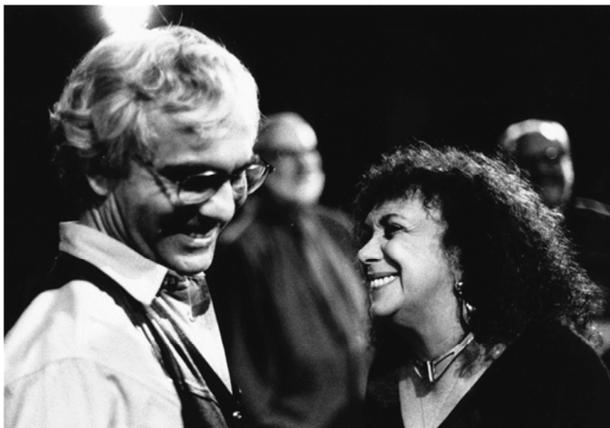
Immagine 7 – Eugenio Barba e Judith Malina, trentesimo anniversario dell'Odin Teatret, Holstebro, 1994