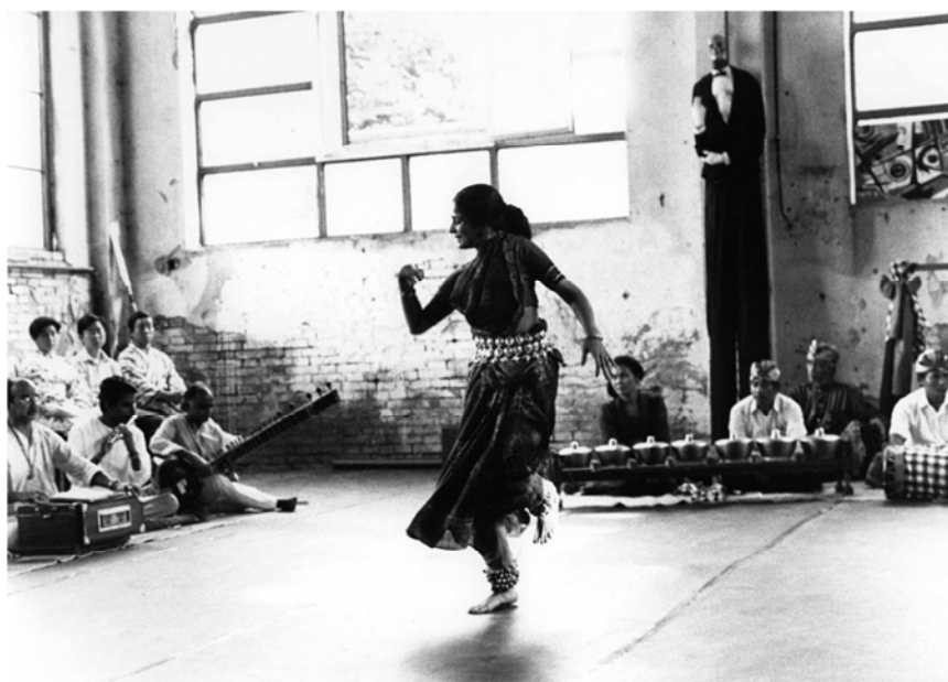
Immagine 10 – Sanjukta Panigrahi, danzatrice Orissi. Baratto alla Fabbrika occupata, Bologna, 1990. Foto di Fiora Bemporad OTA, fondo fotografico, serie cartacea, sottoserie ISTA, b. 6).

Sanjukta Panigrahi (foto di Fiora Bemporad, 1990); scheda sull'ISTA; Ugo Volli sulla scuola degli attori (1980)